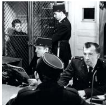
Les 400 coups de François Truffaut