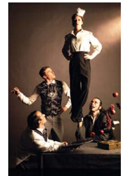
Le Cirque Leroux

Du lundi 15 au dimanche 21 décembre • Cirk'Alors , Cie Lattitude/Atrium : les 15, 16, 18 et 19 décembre à 10h / le 17 décembre à 10h et 16h • The Elephant in the Room , Le Cirque Leroux : le 17 décembre à 14h / le 19 décembre à 20h le 20 décembre à 16h et 20h / le 21 décembre à 17h Tarifs : enfants 8€ / réduit 10€ / adultes 12€ Graine de Cirque - Petit chapiteau / Jardin des Deux Rives / Strasbourg (67) T. 03 88 45 01 00 / www.grainedecirque.asso.fr